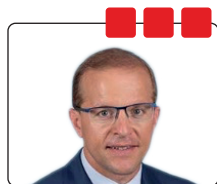
Thibault Bazin, Député de Meurthe-et-Moselle (4 e circ.)

Nous allons passer la parole à Thibault Bazin, qui je le rappelle, est également rapporteur général du budget de la sécurité sociale, un député stratégique dans cette noble institution.