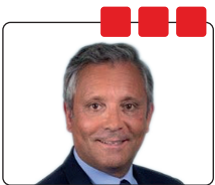
Hervé de Lépinau, Député du Vaucluse (3 e circ.)

Merci beaucoup, Pierre. Je propose que l'on ouvre le débat aux questions.